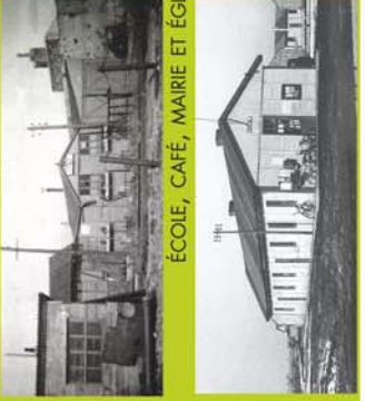
ÉCOLE, CAFÉ, MAIRIE ET ÉGLISE PROVISOIRES