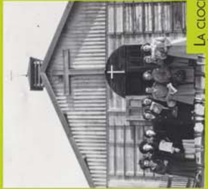
LA CLOCHE DE L'ÉGLISE ST-JACQUES REFOUNDUE À PARTIR DE MORCEAUX RECUPERÉS SUR LES RUINES DE L'ANCIENNE ÉGLISE EN 1946.