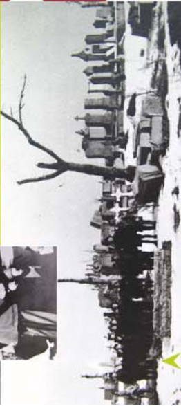
DANS UNE AMBIANCE D'APOCALYPSE, LES ENFANTS CHANTENT « LA MARSEILLAISE »