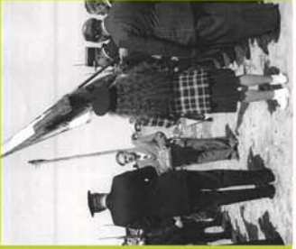
LE GÉNÉRAL DE GAULLE EST VENU RECONFORTE LES GRAND-SYNTHOIS LE 12 AOÛT 1945.